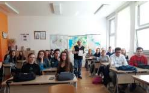
Izlaganje Gorana Hruške u Gimnaziji autor Sanja Musil