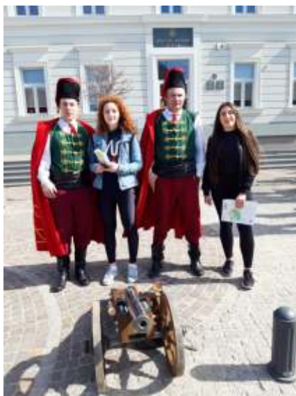
Učenice s počasnom gardom autor Sanja Musil