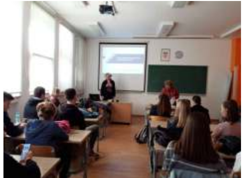
Izlaganje Rahele Jurković u Gimnaziji autor Sanja Musil