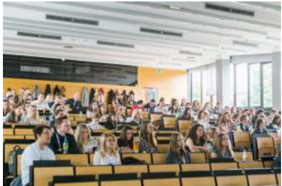
Predstavljanje Grgureva u Zagrebu - auditorij arhiva Kongresa studenata biotehnologije