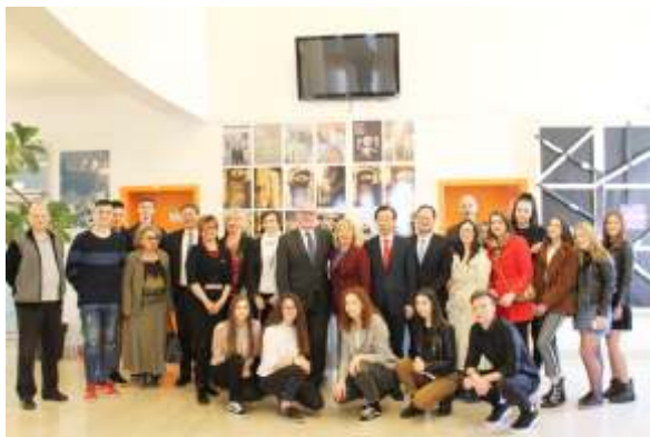
Posjet predstavnika stranih veleposlanstava Gimnaziji arhiva Gimnazije