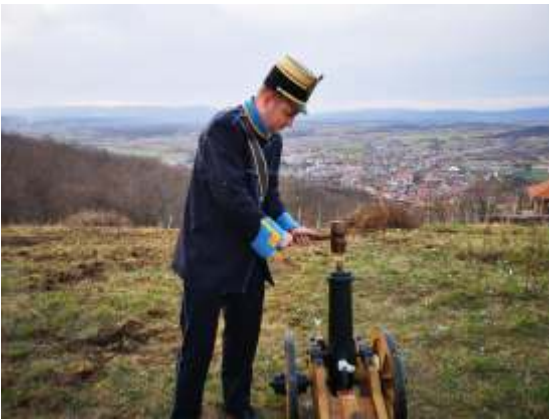
Priprema za pucanje iz topa na Grgurevo 2019