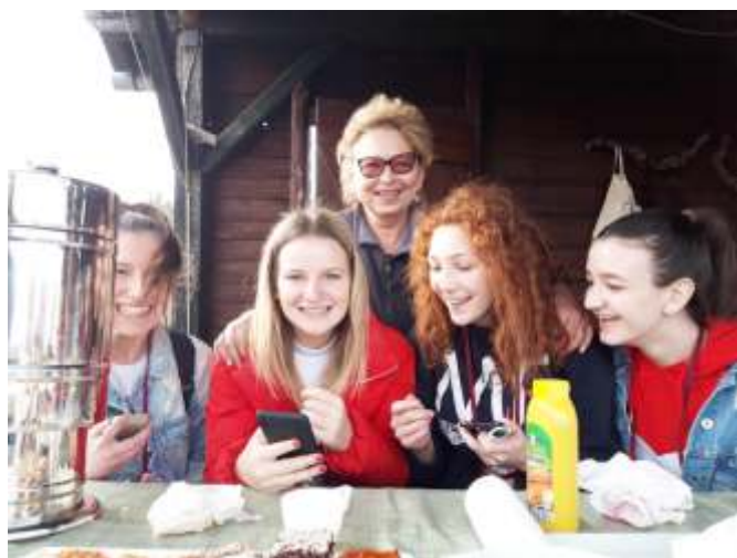
Kod Farkaševih na Grgurevu autor Sanja Musil