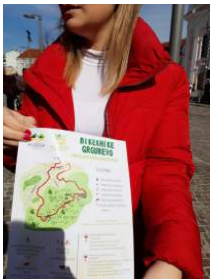
Učenici kreću u istraživanje na Grgurevo 2019, autor Sanja Musil