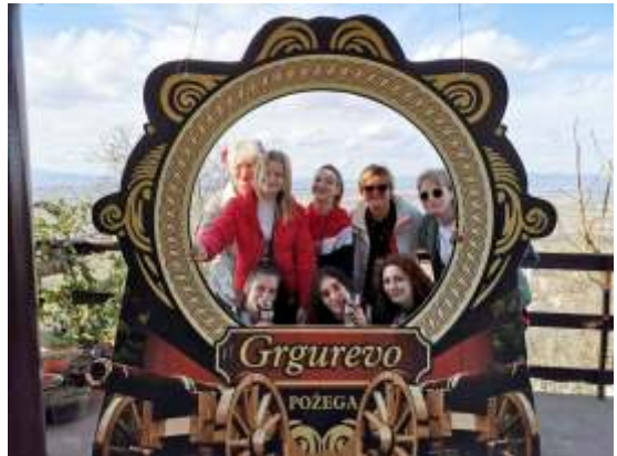
Uspomena na Grgurevo 2019