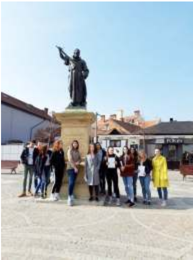
Učenci istražuju Grgurevo autor Sanja Musil