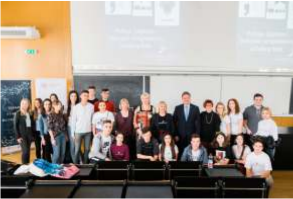
Predstavljanje programa u Zagrebu arhiva Kongresa studenata biotehnologije